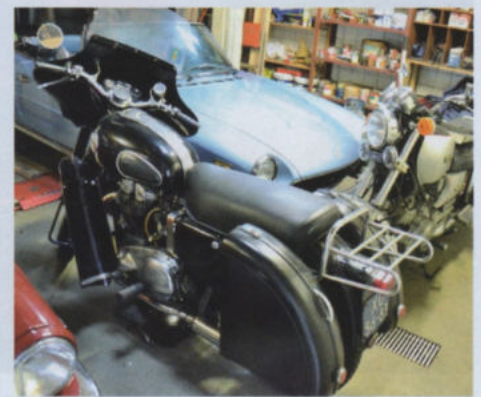
Rondom de Fiat 124 Spider 2000 Turbo een Ariel met alle mogelijke accessoires en een Yamaha.

staan, vandaar! Net als bij de motorfietsen is dit een mix van Brits en Italiaans: Jaguar 340, Armstrong-Siddeley, Triumph Spitfire en Fiat 124 Spider. “Ik heb ook Alfa Romeo gehad, waaronder een Spider. In het motorblok zat een tik die veroorzaakt bleek te zijn door een kapotte zuiger. Hier kwam ik achter, toen ik het blok volledig gedemonteerd had.” Pim laat zich duidelijk niet afschrikken door een stuk techniek en haalt alles zelf tot de laatste schroef uit elkaar. Onderdelen maakt hij eventueel zelf op een klassieke Triumph draaibank met riemaandrijving die in een werkplaatsje staat naast de garageboxen met de verzameling klassiekers. In de werkplaats stond ten tijde van ons bezoek een zeldzame 1953er Ariel KHA met aluminium cilinderkop, die Pim aan het