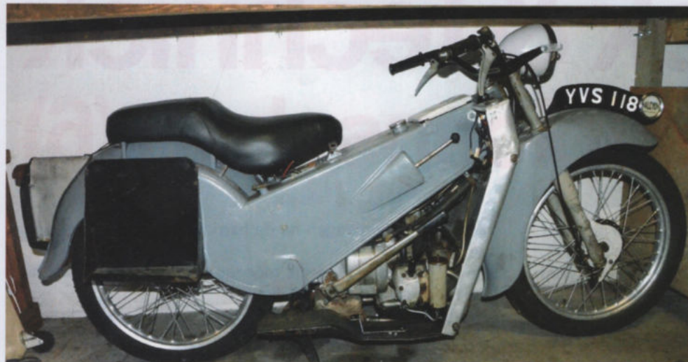
Een Velocette LE die werd gebruikt door de Britse politie.