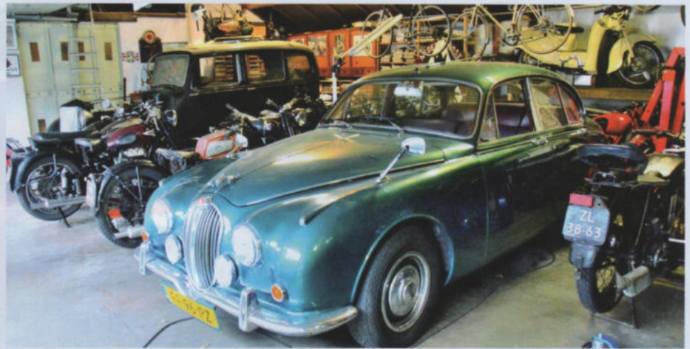
De Jaguar 340 wordt nog regelmatig gebruikt.