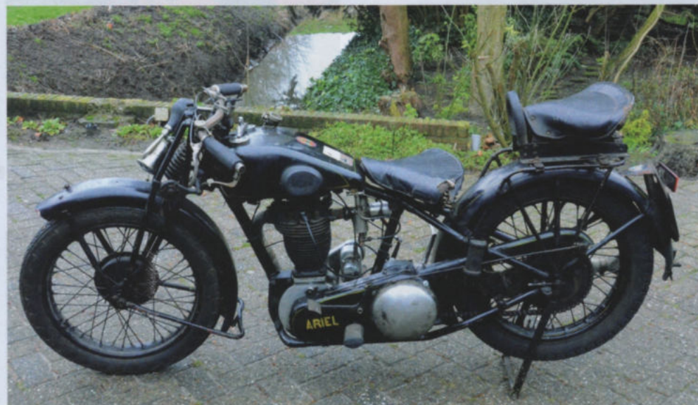
Pim's trouwe metgezel, deze Ariel model C uit 1928 waarmee hij in het verleden 12 maanden per jaar door weer en wind naar zijn werk reed.

het credo te gelden 'hoe meer ruimte je hebt, hoe meer je bewaart' Auto's en motorfietsen staan dicht op elkaar en enkele moeten verplaatst worden om een specifiek exemplaar goed op de foto te krijgen, zoals de Ariel 500cc uit 1919 met carbidhouder op het stuur die de koplamp voedt. "Op deze fiets ben ik getrouwd," legt Pim uit. Ervoor staat een serie Ariels Square Four uit de jaren '30. Er omheen een Ariel KH 500 uit 1957 met originele koffers en alle mogelijk accessoires uit de zogenaamde Avantour-lijn en een Ariel 500 competitie-motor uit 1947 met aluminium cilinder Buiten staat een Model C uit 1928 waarop Pim 80.000 km heeft gereden sinds 1970. In het begin zelfs in de wintermaanden woon/werkverkeer, later met de vrouw toertochten in Frankrijk en Groot-Brittannië. Kortom: Ariels voeren de boventoon. Een passie die begon bij de aanschaf van zijn eerste Ariel in de jaren '60. Een Velo-