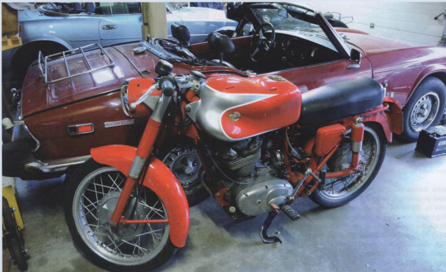
De tank van een Elite is niet origineel op deze Ducati 250 Mach I, maar misstaat niet.