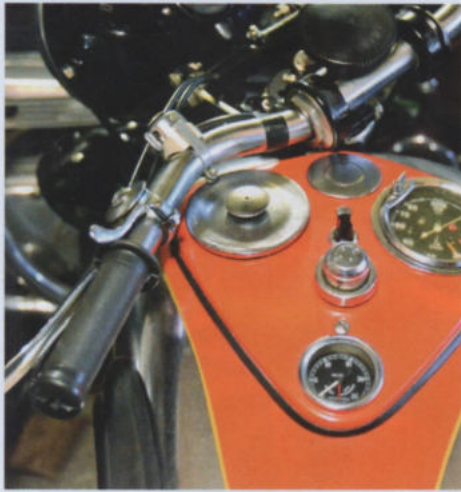
Een blik op de prachtige tank met klokken van een Ariel Square Four.