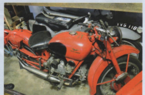
Een lichte 'fiets' van Moto Guzzi, de Cardellino met een simpele, doch doelmatige achtervering.