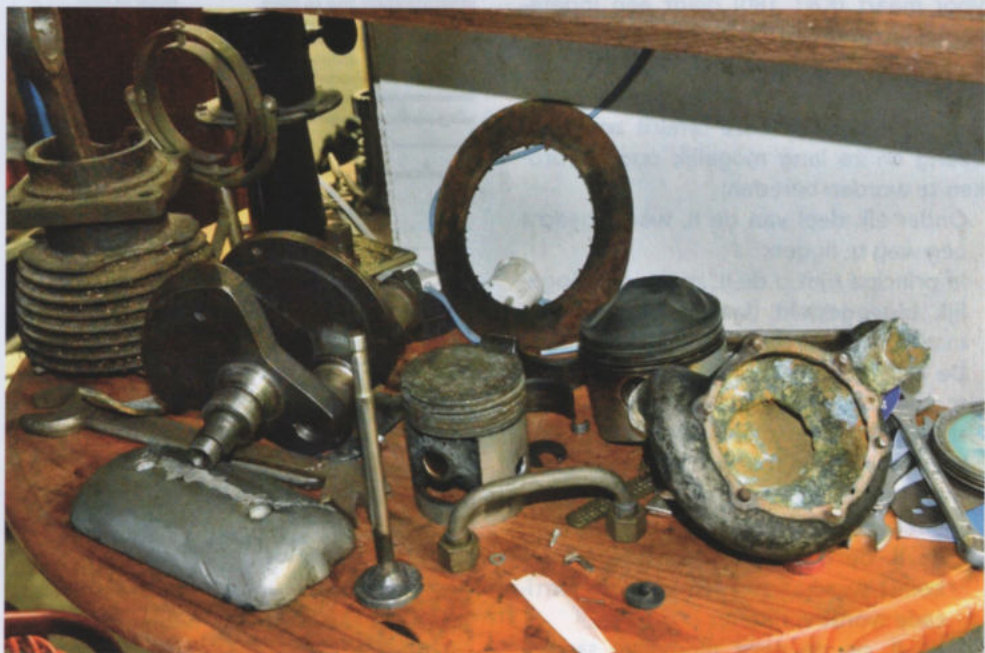
Relikwieën van motorrevisies van o.a. Alfa Romeo en Ariel.