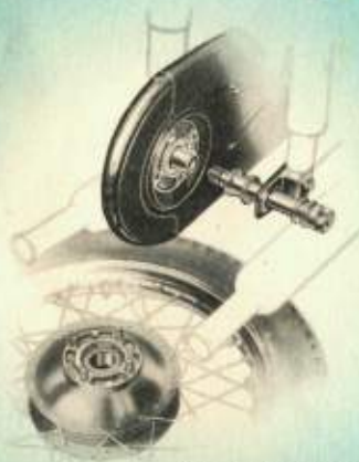
Snel uitneembaar achterwiel met steekas en gesloten achterkettingkast.