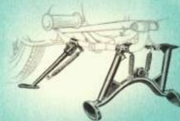
De praktische rol-op middenstandaard en de jiffystand.