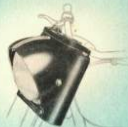
Koplamp en voorvorkomhulling.