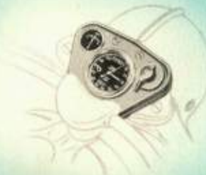
Ingebouwd instrumentenpaneel bevattende lichtschakelaar en verlichte snelheids- en ampèremeter.