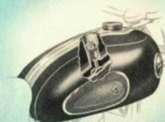
Nieuwe tankbevestiging met centrale bout en rubberkussen. Tankinhoud 20 ltr.